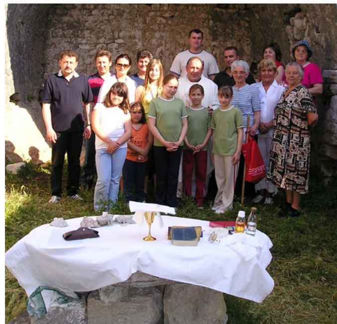
Misa na dan sv. Vida 2006. god

Dvadesetak metara istočnije od crkve nalaze se i ostatci nekog većeg objekta koji je mogao biti u vezi s crkvom. No, crkvu i širi prostor je potrebno arheološki istražiti da bi se dobilo više podataka o preciznoj dataciji i izgledu crkve. Brojni dijelovi arhitekture koji se nalaze ispred i unutar građevine pokazuju da je crkva Sv. Vida pregrađivana i obnavljana.